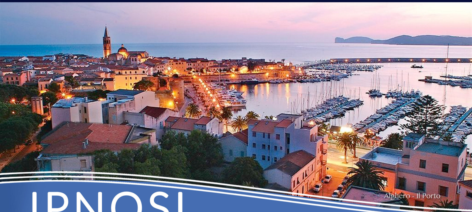
Alghero - Il Porto