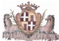
Comune di Sassari